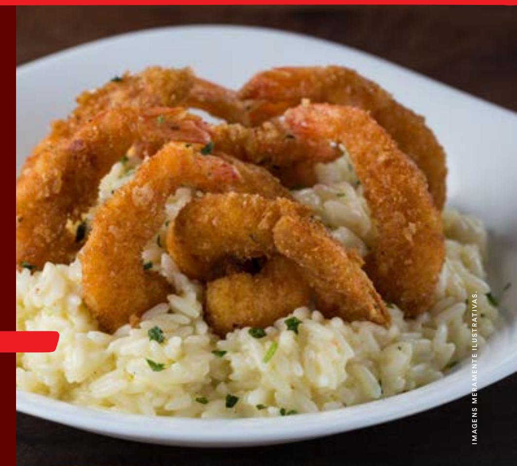
IMAGENS MEVAMENTE ILUSTRATIVAS.